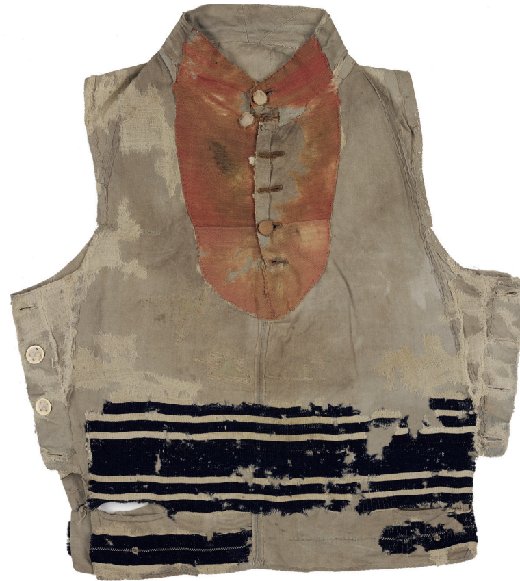
Cidákl, vesta přešitá z talitu, před restaurováním a po něm, Čechy, 18. století / Geniza synagogy v Luži / ŽMP, inv. č. 178.570

Když v polovině 90. let začali pracovníci Židovského muzea v Praze vyzvedávat z půd synagog rozpadající se svazky knih a fragmenty nejrůznějších textilií, ocitli se v podobné situaci jako Solomon Schechter, který sto let před tím objevil genizu synagogy ve Fustátu poblíž egyptské Káhiry. Tato největší a nejznámější geniza světa vydala asi 400 tisíc fragmentů rukopisů a tisků v různých židovských jazycích, texty náboženské, filozofické, i lékařské a také archiválie všeho druhu, materiál z tisíce let židovských dějin, který zásadně změnil pohled na středověký a raně novověký svět. Nálezy z půd českých a moravských synagog jsou skromnější. Přes 3000 předmětů datujeme převážně do 18. a 19. století, výjimečné jsou nálezy starší (16.– 17. století). Předměty pocházejí z 13 lokalit českých a moravských regionů, z menších měst a vesnic, jako je Luže, Rychnov nad Kněžnou, Březnice, Kdyně, Zalužany či Holešov. Místní synagogy procházely v 90. letech 20. století rekonstrukcemi a to, co po staletí leželo na jejich půdách, bylo bezprostředně ohroženo – tak začal jeden z nejdobrodružnějších aktuálních projektů Židovského muzea v Praze.