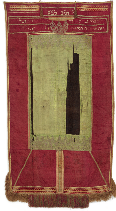
Synagogální opona, Čechy, 1652 / Geniza synagogy v Luži / ŽMP, inv. č. 178.691

Nejčastějšími textovými nálezy z geniz jsou modlitební knihy, a to jak pro všední den ( sidury ), tak pro svátky ( machzory ). Sidur je nejrozšířenější židovskou knihou vůbec: měl-li žid jen jednu jedinou knihu, byl to právě sidur . Tato kniha je průvodcem běžným dnem i celým židovským rokem. Zároveň je i antologie historických i poetických textů, mystických i etických pasáží a praktických pokynů. Kromě modliteb obsahuje například požehnání k různým každodenním činnostem, někdy je k siduru připojena celá kniha žalmů, týdenní úseky textu Tóry ( parašot ), a také micvoť , nařízení. Některá vydání obsahují i židovské kalendáře, nebo hagady , texty pro domácí obřady spojené s oslavou svátku Pesach. Vlastníci těchto knih si do nich často vkládali modlitby, tištěné i rukou psané, které v daném vydání postrádali. Běžné jsou také vpisky o rodinných událostech, např. data narození a úmrtí rodinných příslušníků.