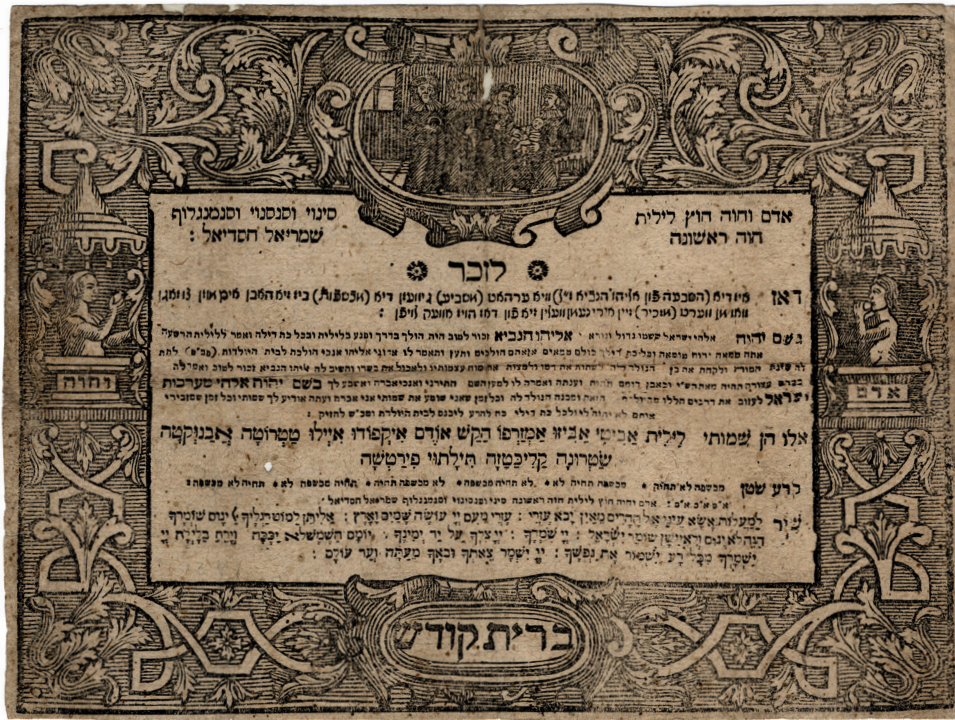
Amulet pro novorozenceho chlapce (kimpetbrivl, kindbetbrieff), Sulzbach, 18. století (?) / Geniza synagogy v Luži / ŽMP, inv. č. 178.801 / Amulet obsahuje biblické verše, Ex 22:7 a Zalm 121, andělská jména Sanoj, Sansanoj, Semangolof a také hebrejská jména Samriell a Chasdiell. Zachycený příběh vypráví hebrejsky a jidiš o démonce Lilil a jejím setkání s prorokem Eliášem. Na jeho otázku, kam jde, Lilil odpovídá, že jde ukrádat dítě tě a tě rodičce, aby mu pila krev, sála morek z kostí a jedla jeho maso. Prorok Eliáš jí v tom pochopitelně zabrání, a aby Lilil unikla jeho klebtě, prozradí mu 14 svých tajných jmen, pomocí nichž jí lze zahnat. V horní části amuletu je v kartuši vyobrazena obrázka, na bocích pak Adam a Eva.

Co je geniza? Je to náboženské nařízení ochraňovat Boží jméno a vztahuje se na všechny písemnosti, které jedno z Božích jmen obsahují, tedy především velké pergamenové svitky Tóry, pěti knih Mojžíšových, dále drobné svitky vkládané do krabiček modlitebních řemínků ( tfilin ), svitky používané do schránek na veřejných dveřích ( mezuzot ) a amulety. Když tyto předměty dosloužily, bylo třeba je odložit tak, abychom vlastní rukou nezničili Boží jméno, aby se takový předmět mohl rozpadnout sám. A k tomu sloužily právě půdy synagog – uzavřené, veřejně nepřístupné prostory, kam místní židovská komunita odkládala nejen opotřebované svitky a modlitební knihy, ale i další předměty používané v synagoze i mimo ni.