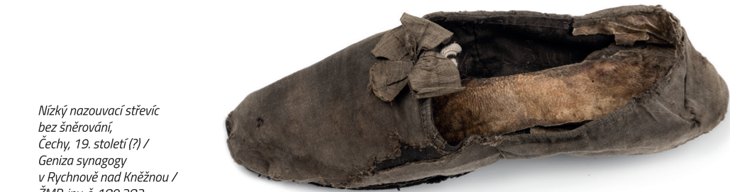
Nizký nazouvací střevíc bez šněrování, Čechy, 19. století (?) / Geniza synagogy v Rychnově nad Kněžnou / ŽMP, inv. č. 180.283