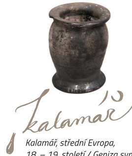
Kalamář, střední Evropa, 18. – 19. století / Geniza synagogy v Holešově / ŽMP, inv. č. 180.405