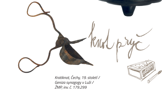
Kratknot, Čechy, 19. století / Geniza synagogy v Luži / ŽMP, inv. č. 179.299