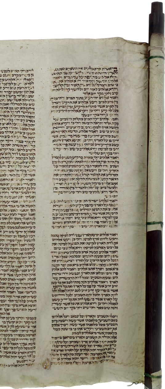
Svítek Tóry (fragment), Čechy, 19. století (?) / Geniza synagogy v Luži / ŽMP, inv. č. 179.652/01,02