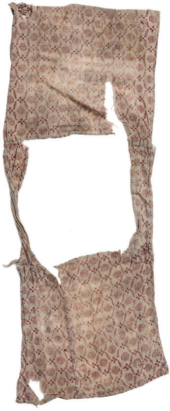
Malý talit (talit katan), Čechy, 19. století / Geniza synagogy v Luži / ŽMP, inv. č. 178.683 / Některé malé tality mají z dosud nezjištěných příčin přetočené jedno ramínko.