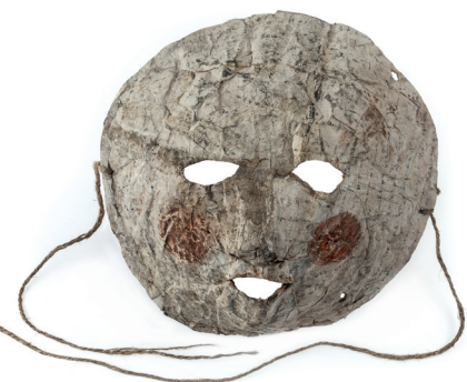
Purimová maska, Holešov, 19. století / Geniza synagogy v Holešově / ŽMP, inv. č. 178.999