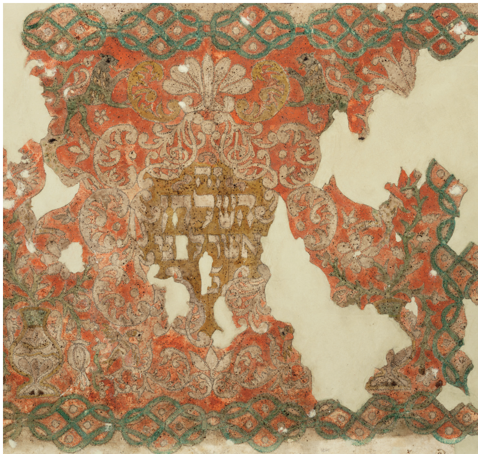
Tabulka Ze ha-šulchan, Čechy, druhá polovina 18. století / Geniza synagogy v Luži / ŽMP, inv. č. 177.937

Když v polovině 90. let začali pracovníci Židovského muzea v Praze vyzvedávat z půd synagog rozpadající se svazky knih a fragmenty nejrůznějších textilií, ocitli se v podobné situaci jako Solomon Schechter, který sto let před tím objevil genizu synagogy ve Fustátu poblíž egyptské Káhiry. Tato největší a nejznámější geniza světa vydala asi 400 tisíc fragmentů rukopisů a tisků v různých židovských jazycích, texty náboženské, filozofické, i lékařské a také archiválie všeho druhu, materiál z tisíce let židovských dějin, který zásadně změnil pohled na středověký a raně novověký svět. Nálezy z půd českých a moravských synagog jsou skromnější. Přes 3000 předmětů datujeme převážně do 18. a 19. století, výjimečné jsou nálezy starší (16.– 17. století). Předměty pocházejí z 13 lokalit českých a moravských regionů, z menších měst a vesnic, jako je Luže, Rychnov nad Kněžnou, Březnice, Kdyně, Zalužany či Holešov. Místní synagogy procházely v 90. letech 20. století rekonstrukcemi a to, co po staletí leželo na jejich půdách, bylo bezprostředně ohroženo – tak začal jeden z nejdobrodružnějších aktuálních projektů Židovského muzea v Praze.