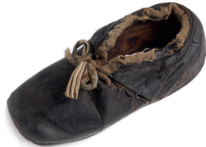
Dětská kožená botka, Čechy, 19. století / Geniza synagogy v Březnici / ŽMP, inv. č. 179.424