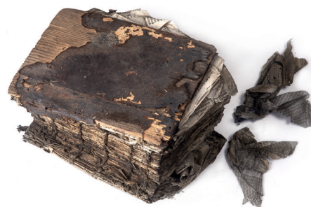
Modlitební kniha Siftej ranenot (fragment), tisk Chajim ben Cvi Hirš, Fürth, 1764 (?) / Geniza synagogy v Rychnově nad Kněžnou / ŽMP, inv. č. 180.599/01-11