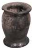
Kalamář / Geniza synagogy v Holešově / ŽMP, inv. č. 180.405