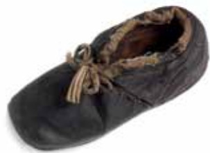
Dětská kožená botka / Geniza synagogy v Březnici / ŽMP, inv. č. 179.424 A child's leather shoe / The genizah of the synagogue in Březnice / JMP, Inv. No. 179.424

Geniza je v první řadě institucí náboženskou. Mezi stovkami modlitebních knih a desítkami svitků se však objevují i předměty, které s náboženstvím nemají žádnou zřejmou spojitost. Je jich výrazně méně než hebrejsky psaných knih a rituálních textilií, zároveň však jejich množství není zanedbatelné. Navíc sobě podobné předměty nacházíme v různých genizách, což potvrzuje, že jejich uložení zde není náhodné. Nejpozoruhodnější je především množství obuvi různého typu a z různých materiálů. Vždy jde o obuv nošenou, použitou. Boty jsou častěji jednotlivé, objevují se však i v páru. V tradičních náboženských písemných pramenech pro tuto praxi nenacházíme žádné vysvětlení. Zdá se, že možné výklady bude třeba hledat i mimo rámec tradičního judaismu: obuv někdy zazdívali do základů budov nebo ke komínu ti, kdo věřili, že takto dům ochrání, podobně jako ostré předměty z kovu či nádoby a lahvičky. Toto vysvětlení nemá oporu v judaismu, můžeme zde však předpokládat vliv okolní nežidovské společnosti. Pohled na půdy synagog ukázal, že s fenoménem genizy se stále pojí mnoho otázek. Jedním z úkolů Židovského muzea v Praze je hledat na ně odpovědi.