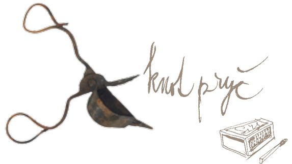
Kratiknot, Čechy / Geniza synagogy v Luži / ŽMP, inv. č. 179.299 Candle snuffer / The genizah of the synagogue in Luže / JMP, Inv. No. 179.299

First and foremost, the genizah is a religious institution. Among the hundreds of prayer books and dozens of scrolls, however, there are also objects that have no obvious connection to religion. They are considerably fewer than the Hebrew books and ceremonial textiles, but their number is nevertheless not negligible. Moreover, similar objects have been found in various genizot, which goes to show that they were not placed there accidentally. Most remarkable is the abundance of shoes of various types and materials. All of the shoes are worn out. Some, but not most, of them are in pairs. No explanation for the discarding of shoes in this way has been found in traditional religious written sources. Possible interpretations will probably have to be sought outside the framework of traditional Judaism: it was customary for some people to conceal shoes, as well as sharp metal objects, containers or bottles, in the fabric of a building or in the chimney – in the belief that this would protect a house against evil forces. This explanation has no basis in Judaism, but it seems reasonable to assume that there was an influence from the surrounding non-Jewish society. An exploration of synagogue attics shows that there are still many unanswered questions relating to the genizah phenomenon. One of the tasks of the Jewish Museum in Prague is to seek answers to these questions.