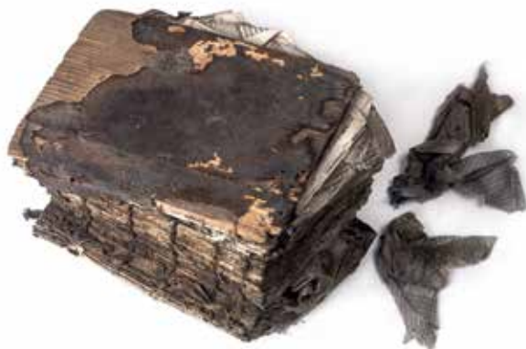
Modlitební kniha Siftej ranenot (fragment) / Geniza synagogy v Rychnově nad Kněžnou / ŽMP, inv. č. 180.599/01-11 Siftej Ranenot prayer book (fragment) / The genizah of the synagogue in Rychnov nad Kněžnou / JMP, Inv. No. 180.599/01-11

Co je geniza? Je to náboženské nařízení ochraňovat Boží jméno a vztahuje se na všechny písemnosti, které jedno z Božích jmen obsahují, tedy především velké pergamenové svitky Tóry, pěti knih Mojžíšových, dále drobné svitky vkládané do krabiček modlitebních řemíků ( tfilin ), svitky používané do schránek na veřejných dveřích ( mezuzah ) a amulety. Když tyto předměty dosloužily, bylo třeba je odložit tak, abychom vlastní rukou nezničili Boží jméno, aby se takový předmět mohl rozpadnout sám. A k tomu sloužily právě půdy synagog – uzavřené, veřejně nepřístupné prostory, kam místní židovská komunita odkládala nejen opotřebované svitky a modlitební knihy, ale i další předměty používané v synagoze i mimo ni.