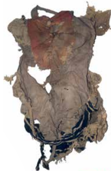
Sáček na modlitební řemínky / Geniza synagogy v Rychnově nad Kněžnou / ŽMP, inv. č. 179.442 Tefillin bag / The genizah of the synagogue in Rychnov nad Kněžnou / JMP, Inv. No. 179.442

Synagogue attics have also been used as repositories for textiles that had previously protected and adorned Torah scrolls – in addition to textual relics that contain the names of God. In particular Torah binders (wrappers for the Torah scroll), but also bimah covers on which the scrolls are placed when read. These textiles have sanctity in themselves by virtue of their close proximity to the Torah scroll and because they touch the holy name of God. Therefore, when no longer in use, they may not be thrown away with regular waste. Their destination is the same as that of the scrolls – a genizah. The mantle that covers the scroll in the holy ark ( aron ha-kodesh ) also ends up here. Torah ark curtains and valances, which cover the holy ark, are less frequently to be found in such a repository. Ceremonial textiles for personal use, such as small prayer shawls ( tallitot ) and tefillin bags, however, are often placed in a genizah.