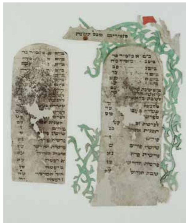
Vyřezávanka s rozpisem Žalmů pro celý rok, Luže / Geniza synagogy v Luži / ŽMP, inv. č. 179.698 Paper-cut with a yearly schedule for reading the psalms / The genizah of the synagogue in Luže / JMP, Inv. No. 179.698

Nejčastějšími textovými nálezy z geniz jsou modlitební knihy, a to jak pro všední den ( sidury ), tak pro svátky ( machzory ). Sidur je nejrozšířenější židovskou knihou vůbec: měl-li žid jen jednu jedinou knihu, byl to právě sidur . Tato kniha je průvodcem běžným dnem i celým židovským rokem. Zároveň je to i antologie historických i poetických textů, mystických i etických pasáží a praktických pokynů. Kromě modliteb obsahuje například požehnání k různým každodenním činnostem, někdy je k siduru připojena celá kniha žalmů, týdenní úseky textu Tóry ( parašot ), a také micvot , nařízení. Některá vydání obsahují i židovské kalendáře, nebo hagady , texty pro domácí obřady spojené s oslavou svátku Pesach. Vlastníci těchto knih si do nich často vkládali modlitby, tištěné i rukou psané, které v daném vydání postrádali. Běžné jsou také vpisky o rodinných událostech, např. data narození a úmrtí rodinných příslušníků.