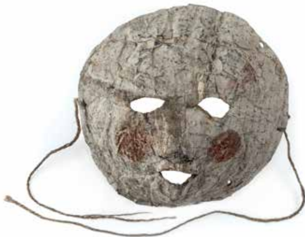
Purimová maska / Geniza synagogy v Holešově / ŽMP, inv. č. 178.999 Purim mask / The genizah of the synagogue in Holešov / JMP, Inv. No. 178.999