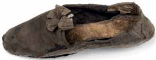
Nízký nazouvací střevíc bez šněrování / Geniza synagogy v Rychnově nad Kněžnou / ŽMP, inv. č. 180.283 A low-heel laceless slip-on shoe / The genizah of the synagogue in Rychnov nad Kněžnou / JMP, Inv. No. 180.283

reading desks in synagogues. Very little, however, is still known about the use of these plaques.