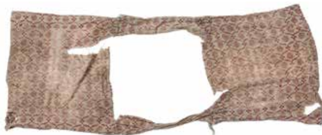
Malý talit (talit katan) / Geniza synagogy v Luži / ŽMP, inv. č. 178.683 Small tallit (tallit katan) / The genizah of the synagogue in Luže / JMP, Inv. No. 178.683

What is a genizah? It is a religious injunction to protect the holy name of God. It applies to all writings that contain any of the names for God – in particular the large parchment scrolls of the Torah (the five books of Moses), but also the small scrolls in prayer boxes ( tefillin or phylacteries), the scrolls inside the boxes that are attached to doorposts ( mezuzah cases), and amulets. According to Jewish custom, worn-out or disused writing materials that contain God's name must not be destroyed by one's own hand. Instead, they are left to disintegrate naturally, typically in a synagogue attic – an enclosed, publicly inaccessible space where the local Jewish community deposits not only worn-out scrolls and prayer books, but also other items once used inside and outside the synagogue.