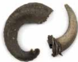
Beraní roh, polotovár určený pro výrobu šofaru / Geniza synagogy v Břežnici / ŽMP, inv. č. 180.492/01,02 Ram's horn, semi-finished product for making a shofar / The genizah of the synagogue in Břežnice / JMP, Inv. No. 180.492/01,02

Nejčastějšími textovými nálezy z geniz jsou modlitební knihy, a to jak pro všední den ( sidury ), tak pro svátky ( machzory ). Sidur je nejrozšířenější židovskou knihou vůbec: měl-li žid jen jednu jedinou knihu, byl to právě sidur . Tato kniha je průvodcem běžným dnem i celým židovským rokem. Zároveň je to i antologie historických i poetických textů, mystických i etických pasáží a praktických pokynů. Kromě modliteb obsahuje například požehnání k různým každodenním činnostem, někdy je k siduru připojena celá kniha žalmů, týdenní úseky textu Tóry ( parašot ), a také micvot , nařízení. Některá vydání obsahují i židovské kalendáře, nebo hagady , texty pro domácí obřady spojené s oslavou svátku Pesach. Vlastníci těchto knih si do nich často vkládali modlitby, tištěné i rukou psané, které v daném vydání postrádali. Běžné jsou také vpisky o rodinných událostech, např. data narození a úmrtí rodinných příslušníků.