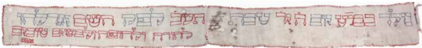
Obřízkový povijan na Tóru / Geniza synagogy v Kasejovicích / ŽMP, inv. č. 180.165