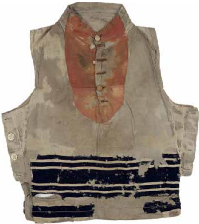
Cidákl, vesta přešitá z talitu, před restaurováním a po něm / Geniza synagogy v Luži / ŽMP, inv. č. 178.570 Tzidakel (waistcoat from a tallit), before and after conservation / The genizah of the synagogue in Luže / JMP, Inv. No. 178.570

Vedle textových památek s Božími jmény se na půdách ocitly i textilie, které chránily a zdobily svitky Tóry. Především jsou to povijany na Tóru, které svitek obepínaly, a dále synagogální pokrývky, na které se pokládal rozvinutý svitek, z nějž se četlo. Tyto textilie byly svitku nejbliž a díky dotyku s posvátným Božím jménem na ně přecházela část jeho svatosti. Když dosloužily, nemohly tedy skončit v běžném odpadu a jejich cesta vedla podobně jako cesta svitků – do genizy. Svitku se dotýkaly i pláštiky na Tóru, které halily zavinitý svitek ve svatostánku ( aron ha-kodesh ). Méně často v genizách nacházíme synagogální opony a drapérie, zakrývající svatostánek. Naopak časté jsou v genizách osobní rituální textilie jako malé tality a sáčky na modlitební řemínky.