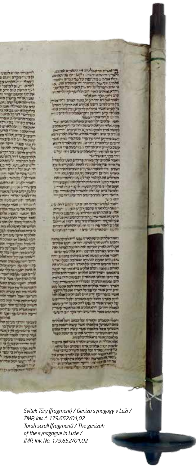
Švitek Tóry (fragment) / Geniza synagogy v Luži / ŽMP, inv. č. 179.652/01,02 Torah scroll (fragment) / The genizah of the synagogue in Luže / JMP, Inv. No. 179.652/01,02