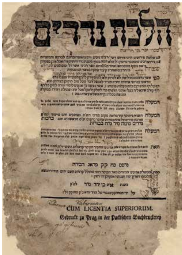
Hilchot nedarim, fragment tisku Babylonského talmudu / Geniza synagogy v Rychnově nad Kněžnou / ŽMP, inv. č. 180.853 Hilchot Nedarim, an edition of the Babylonian Talmud (fragment) / The genizah of the synagogue in Rychnov nad Kněžnou / JMP, Inv. No. 180.853

Co je geniza? Je to náboženské nařízení ochraňovat Boží jméno a vztahuje se na všechny písemnosti, které jedno z Božích jmen obsahují, tedy především velké pergamenové svitky Tóry, pěti knih Mojžíšových, dále drobné svitky vkládané do krabiček modlitebních řemíků ( tfilin ), svitky používané do schránek na veřejných dveřích ( mezuzah ) a amulety. Když tyto předměty dosloužily, bylo třeba je odložit tak, abychom vlastní rukou nezničili Boží jméno, aby se takový předmět mohl rozpadnout sám. A k tomu sloužily právě půdy synagog – uzavřené, veřejně nepřístupné prostory, kam místní židovská komunita odkládala nejen opotřebované svitky a modlitební knihy, ale i další předměty používané v synagoze i mimo ni.