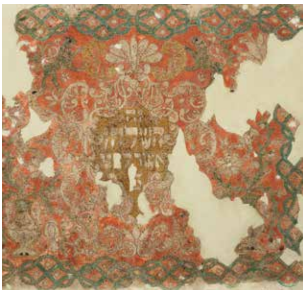
Tabulka Ze ha-šulchan / Geniza synagogy v Luži / ŽMP, inv. č. 177.937 Zeh ha-shulhan plaque / The genizah of the synagogue in Luže / JMP, Inv. No. 177.937

Genizové nálezy jsou rovněž autentickými průvodci židovskými svátky. Nalezený opracovaný beraní roh se měl stát šofarem, nástrojem, jehož zvuk vybízí k pokání na vysoké svátky, a Jom kipur v období mezi Roš ha-šana , židovským Novým rokem, Jom kipur , Dnem pokání. K Sukot , svátku stánků, odkazují v genize zejména nenápadné svazečky vrbových proutků, aravot , jež jsou součástí arba minim , tedy svazku čtyř druhů rostlin, kterými se na tento svátek třese během předepsaného rituálu. Svátek Purim je v genize zastoupen jak texty biblické knihy Ester, tak i unikátní maskou. Součástí tohoto svátku je totiž kromě společného předčítání celého svitku Ester veselá oslava spojená s popíjením a nošením masek a také lidovými hrami na motivy příběhu záchrany židů za vlády krále Achašveroše a jeho židovské manželky Ester. I tyto hry zanechaly stopu v knižní produkci nalezené v genizách.