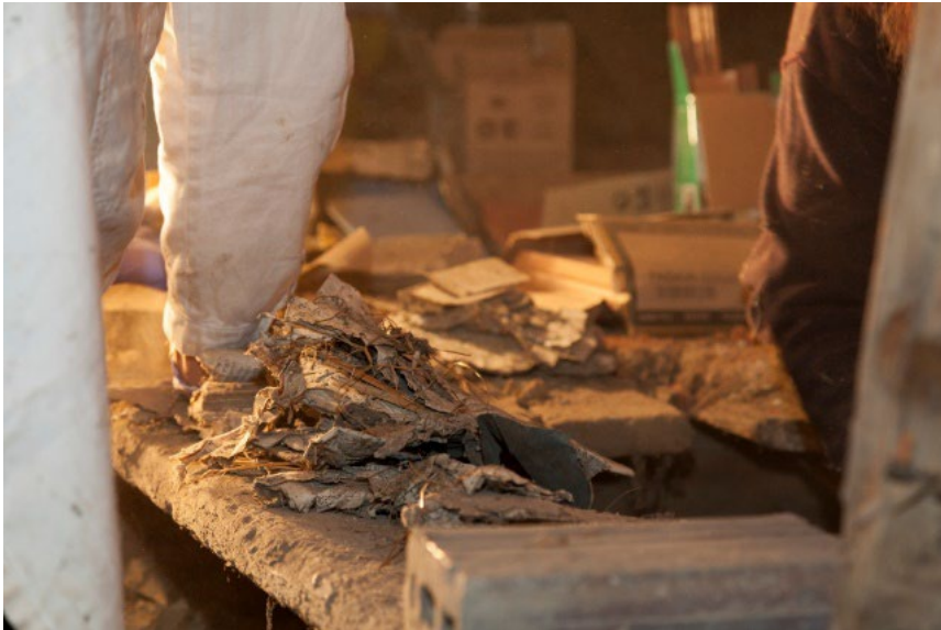
...a mnoho různých nálezů z papíru.