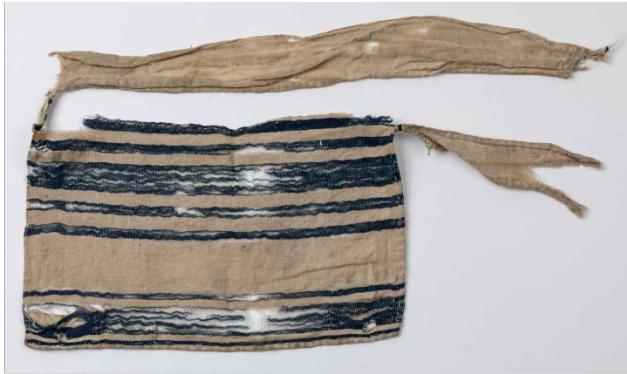
.....talit – modlitební plášť, který nosí židé při modlitbě....